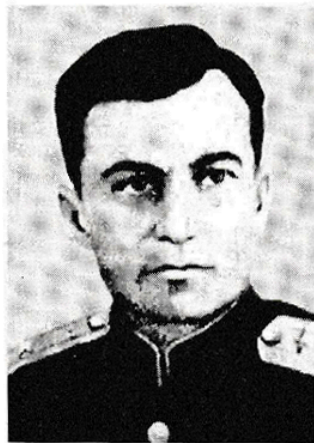
Амет-Хан Султан, дважды Герой Советского Союза